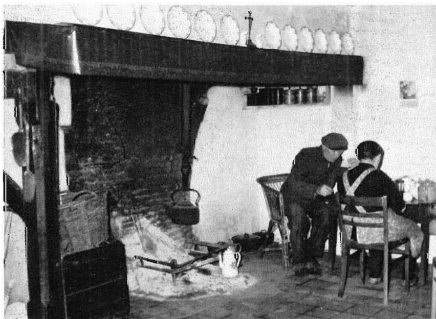
17. Hoeve Grazenseweg 3, Nieuw-Ginneken. Maaltijd bij de haard. juni 1960.